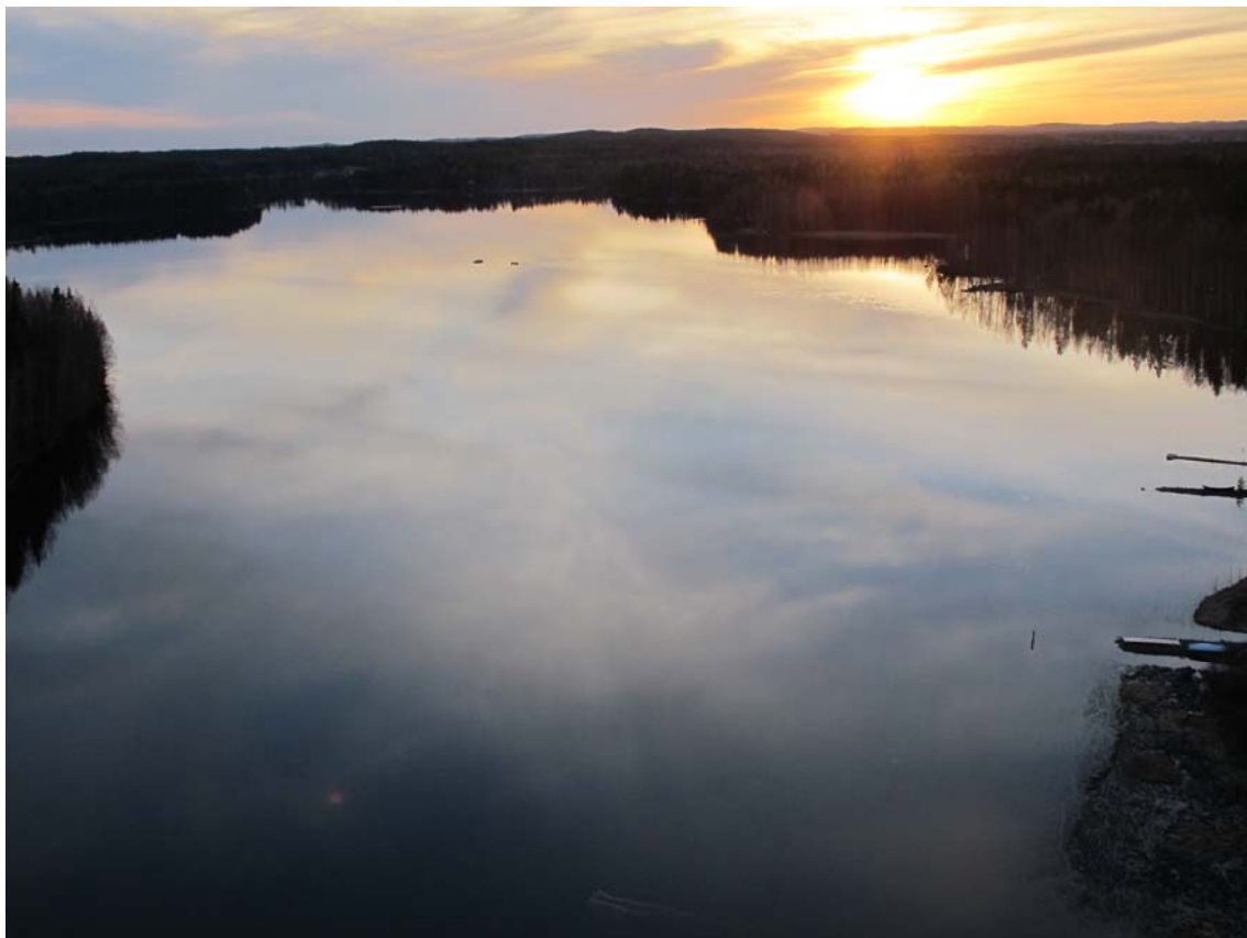
Kuva 1. Onnettomuuspaikka kuvattuna lääkärihelikopterista. Kuva on otettu laskeutumissuunnassa 17.33 UTC.