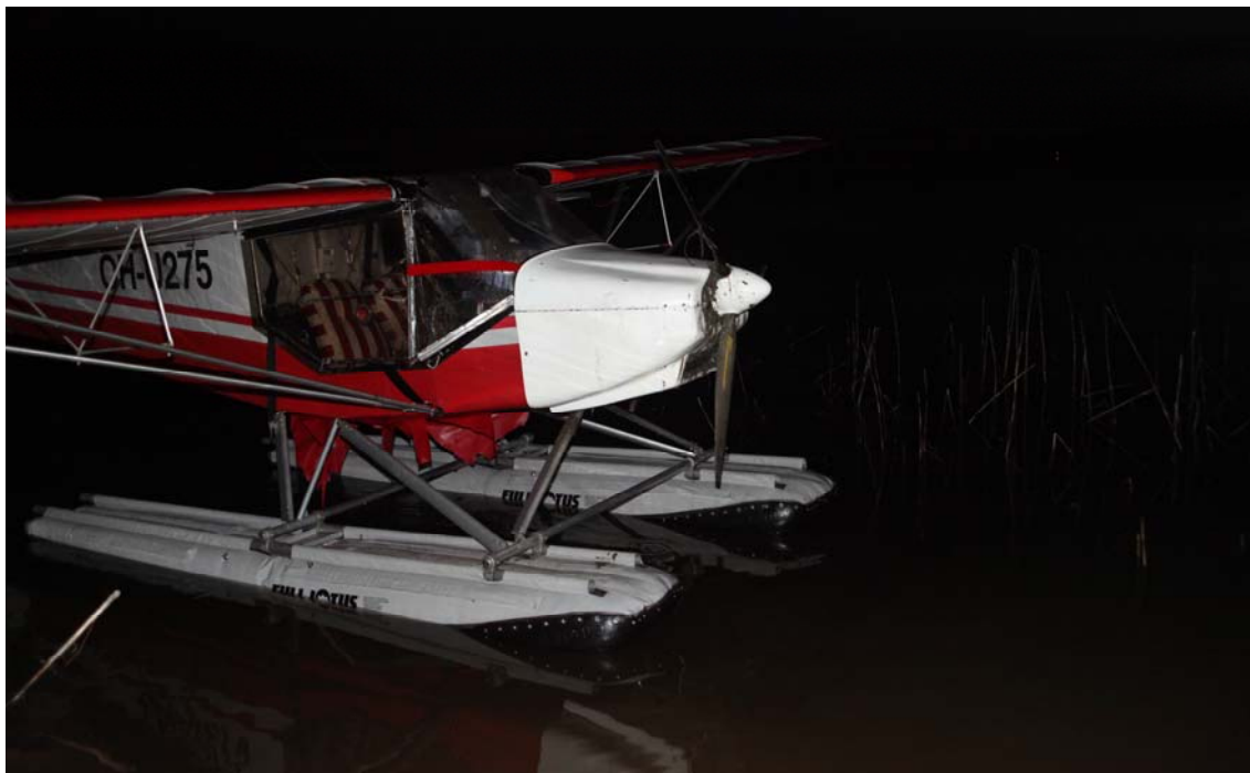
Kuva 2. Lentokone oikeinpäinkääntämisen jälkeen.