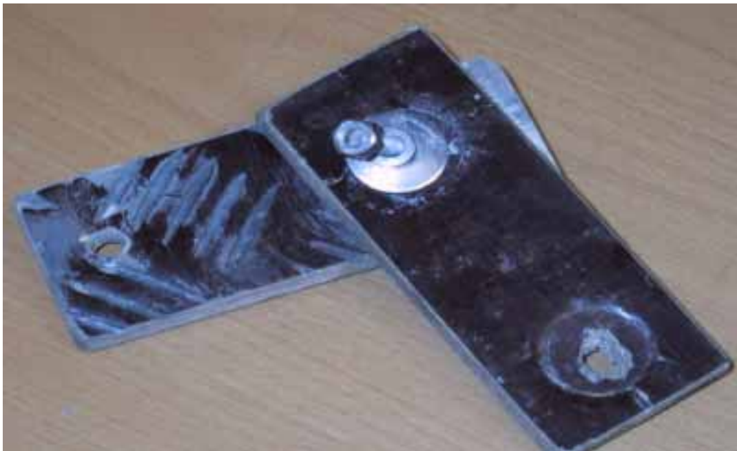
Kuva 4 Kiinnityksessä käytetyt vesivanerin palat, joista toinen (kuvassa päällimmäinen) oli asennettuna kellukkeen sisäpuolelle ja toinen ulkopuolelle täkkilevyn päälle. Kuvassa näkyy täkkilevyn kohokuvion kaivautuminen vaneriin, joka osaltaan on aiheuttanut pultti-liitoksen löystymisen.

On ilmeistä, että tässä tapauksessa kiinnityksien löystyminen ja mahdollisesti myös mutterin irtoaminen olisi voitu havaita, jos kiinnitykset olisi tarkastettu ennen viimeistä lentoa tai jopa aikaisempienkin lentojen välillä, sillä kiinnitysosissa oli tyyppisiä löysästä kiinnityksestä syntyneitä kulumisjälkiä.