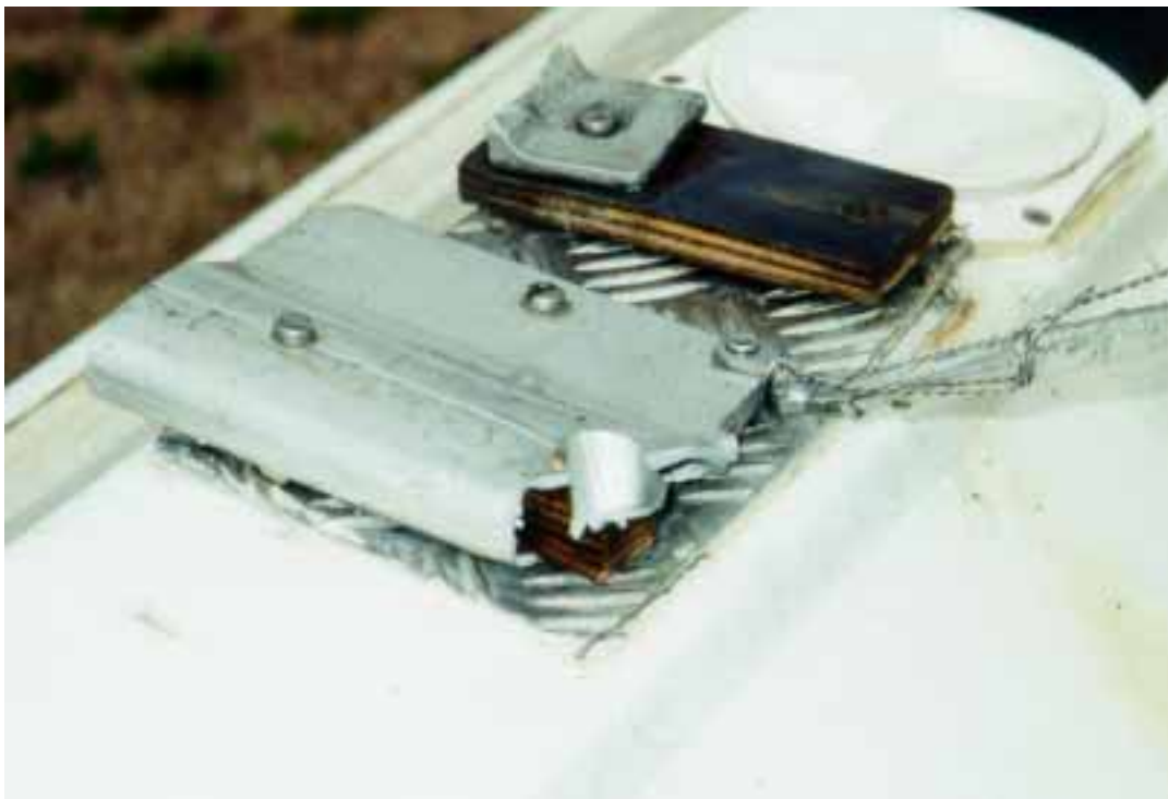
Kuva 3. Oikean päälaskutelineen kiinnitysosat onnettomuuden jälkeen. Kuvassa näkyy katkennut kellukkeita yhdistänyt poikkituki ja murtunut kiinnityskorvake. Toinen korvake jäi ehyenä kiinni laskutelineen akseliin.