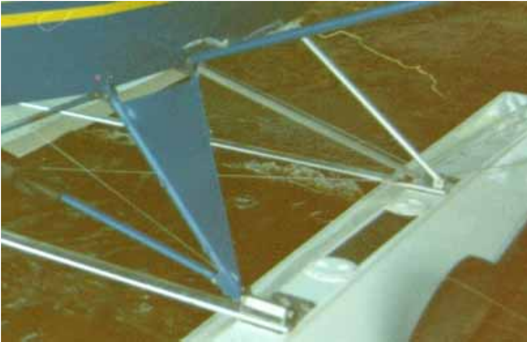
Kuva 2. Ranualla tehty kellukeasennus (kuva on otettu ennen vaneripalojen asentamista etukiinnitykseen)