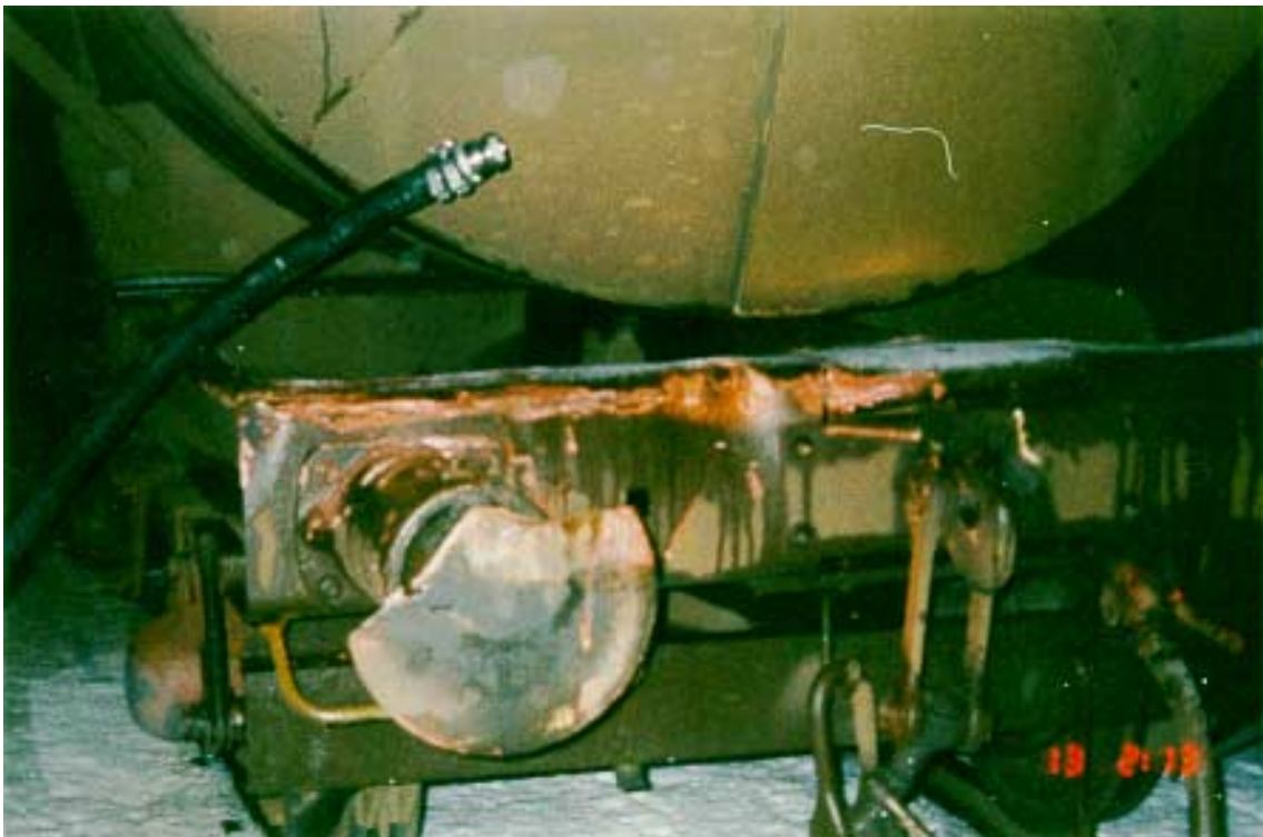
Kuva 4. Piifluorivetyhappovaunun suistuminen ja happovuoto Jämsän ratapihalla 12.12.1996. Suistuneen vaunun etupuolella kulkeneen vaunun rikkoutunut puskin.

Figure 3. A tank wagon derailing and leaking out acid in Jämsä, on 12 December 1996. The firemen used rubber plate to block the leakage. They tightened the rubber plate standing still by using a load binding belt and a log.