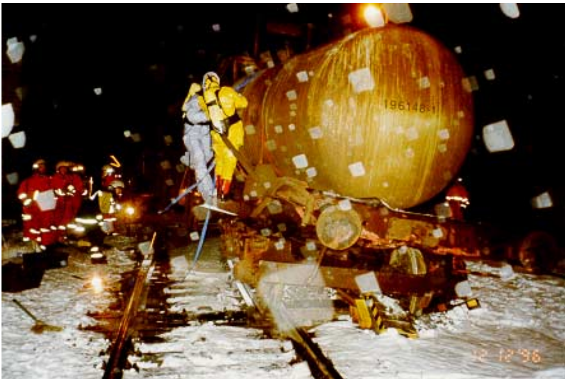
Kuva 2. Piifluorivetyhappovaunun suistuminen ja happovuoto Jämsän ratapihalla 12.12.1996. Palomiehet tukkimassa happovuotoa. Figure 2. A tank wagon derailing and leaking out acid in Jämsä, on 12 December 1996. The firemen blocking the leakage.