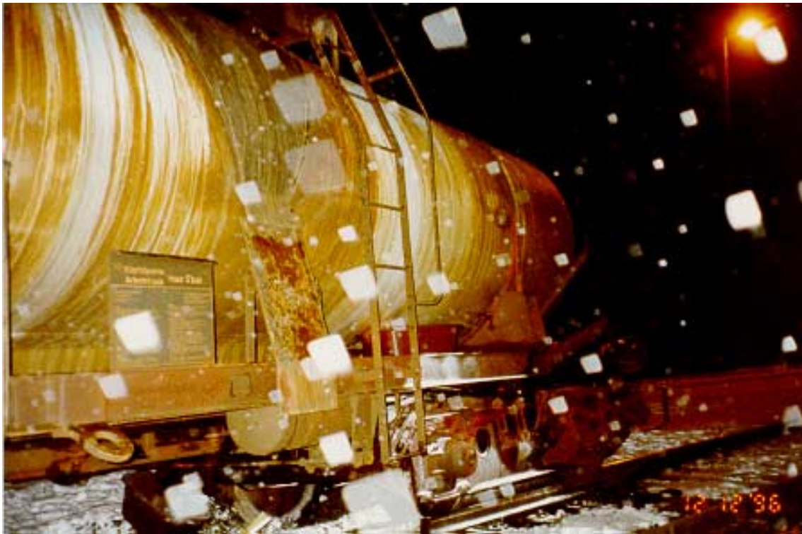
Kuva 1. Piifluorivetyhappovaunun suistuminen ja happovuoto Jämsän ratapihalla 12.12.1996. Aluksi happovuoto oli vähäinen ja käytettiin muoviasiaa vuotokohdan alla. Työskentelyä häiritsi lumisade. Figure 1. A tank wagon derailing and leaking out acid in Jämsä, on 12 December 1996. At first the leakage was slight and there was a plastic basin under the leakage spot.