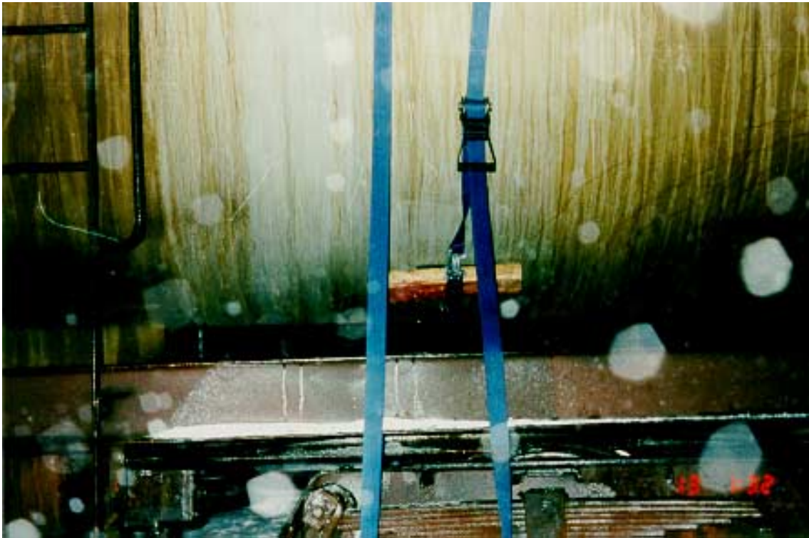
Kuva 3. Piifluorivetyhappovaunun suistuminen ja happovuoto Jämsän ratapihalla 12.12.1996. Palomiehet käyttivät vuodon tukkimiseen solukumilevyä, joka kiristettiin paikalleen kuormansidontaliinan ja langun avulla.

Figure 3. A tank wagon derailing and leaking out acid in Jämsä, on 12 December 1996. The firemen used rubber plate to block the leakage. They tightened the rubber plate standing still by using a load binding belt and a log.